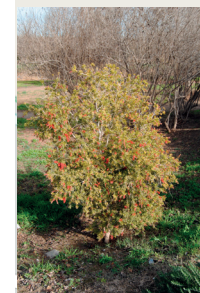
41. Netajatubs ( Callistemon rigidus )