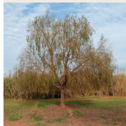
24. Desmai ( Salix babylonica )