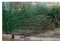
10. Jonc ( Juncus acutus )