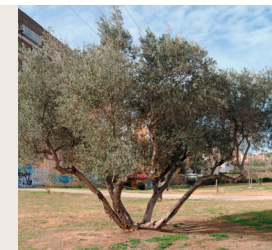
19. Olea ( Olea europaea )