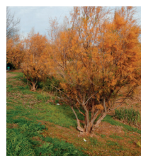
22. Tamarit ( Tamarix gallica )